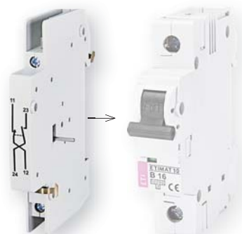
PS ETIMAT 10