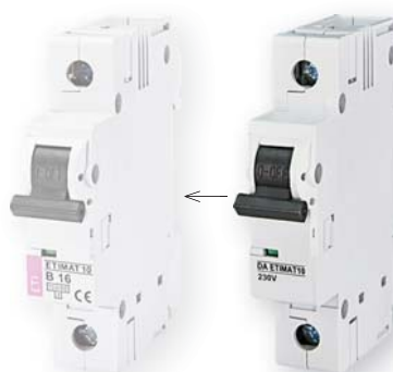
DA ETIMAT 10

Описание: Маркировочное окошко служит для обозначений защищаемых цепей.