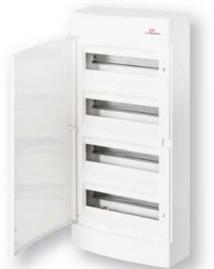
ЕСТ 48 РО