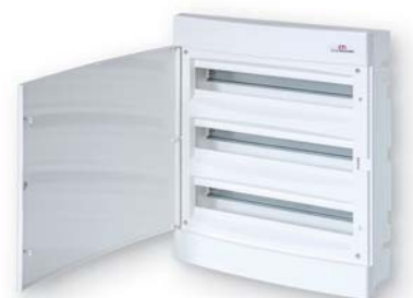
ЕСМ 36 РО