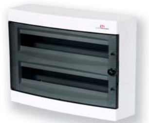
ЕСТ 2x18 РТ