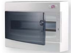
ЕСТ 12 РТ