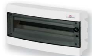
ЕСМ 12 РТ