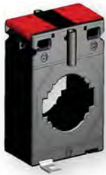
Монтаж на панель

Применение - Измерительные трансформаторы тока предназначены для уменьшения первичных токов до значений, необходимых для подключения измерительных приборов, реле защиты, устройств автоматики и т. д.