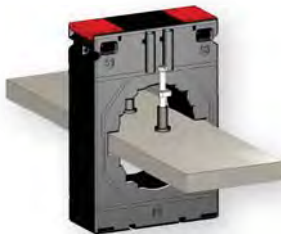
Монтаж на шину